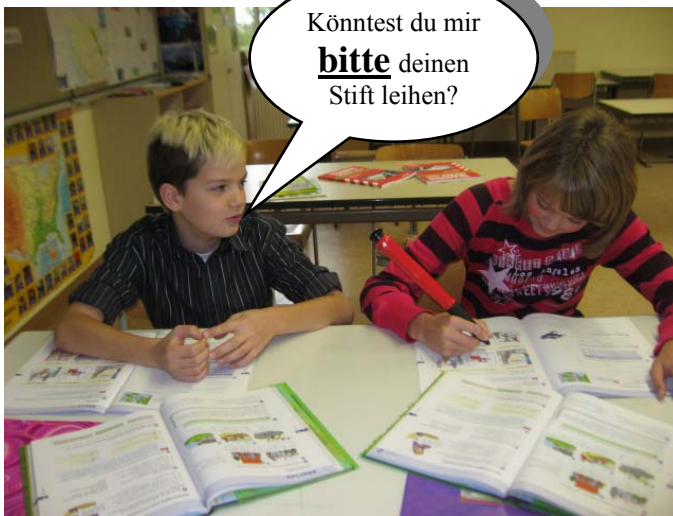
1. Wir sagen "Bitte" und "Danke"!

Wie schon im vorigen Jahr wollen wir an unserer Schule versuchen unsere drei Sozialziele, die wir uns letztes Jahr vorgenommen haben, zu erreichen. Falls ihr sie in den Ferien vergessen haben solltet, hier sind sie noch einmal: