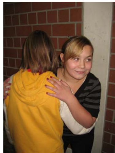
2. Wir grüßen uns freundlich!